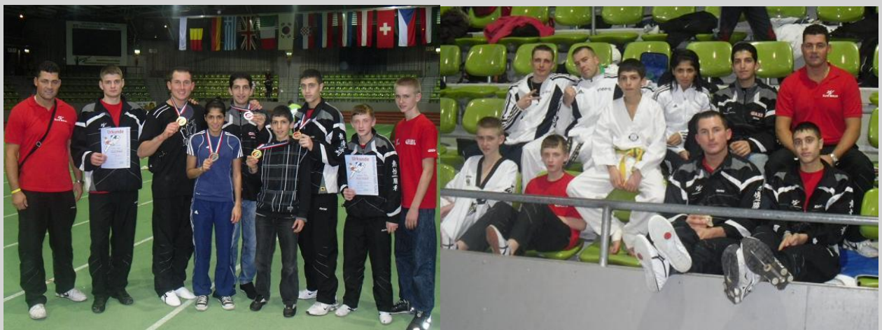
Unser Team erfolgreich nach dem Turnier.