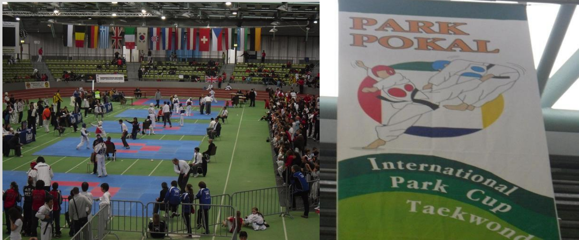
Der Glaspalast in Sindelfingen.

Bei einem der größten Taekwondo – Turniere Deutschlands, ja vielleicht sogar Europas, kämpften am ersten Dezemberwochenende ca. 700 Teilnehmer aus 20 Nationen in ihren Gewichtsklassen im Sindelfinger Glaspalast um wichtige Ranglistenpunkte und den Sieg im Olympischen Vollkontakt Taekwondo. Wir waren mit unserem Team dabei.